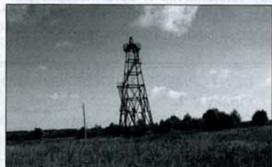
Эксплуатационная скважина рассолопромысла