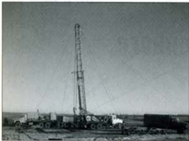
Геофизическое обследование подземных камер растворения

следнее выполняет роль крепи выработок. При существующих геометрических размерах полостей (диаметр \approx 100 м, высота — от нескольких метров до сотен метров) на подрабатываемых территориях скорость оседаний земной поверхности составляет всего 4–10 мм в год, что практически гарантирует безопасное функционирование подрабатываемых объектов.