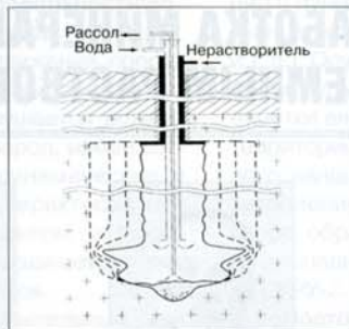
Рис. 2. Отработка штоковых каменно-соляных месторождений высокими камерами методом заглубленной вододачи

Идея подземного растворения калийных солей в нашей стране, в том числе сильвинитовых месторождений, возникла более 50 лет назад, однако практическое применение растворения сильвинитов было осуществлено на опытной установке Карлюкско-