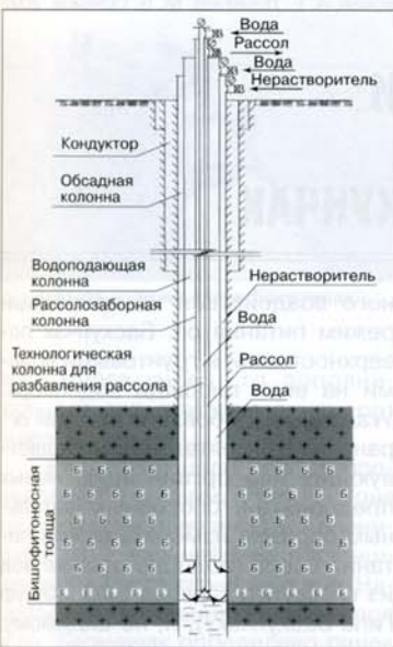
Рис. 3. Конструкция скважины для добычи раствора бишофита

Возможны два режима подземного растворения карналлитовой породы: